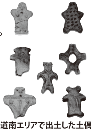
道南エリアで出土した土偶